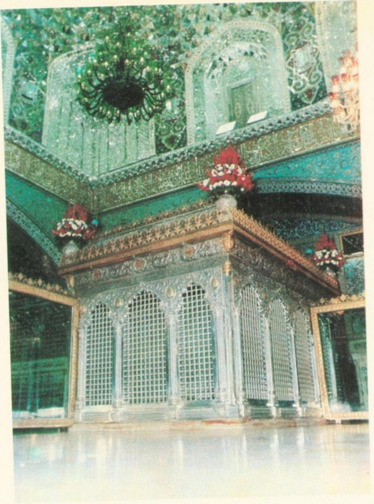
Hz. Ali er-Riza (a.s.)'ın Mukaddes Mezarından Bir Görüntü Meşhed - İran