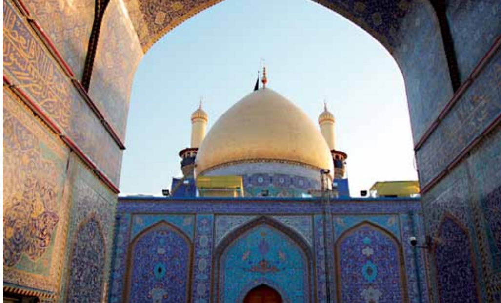
IMAAMI HUSSEININ PYHÄTÖ KARBALASSA.

Yhdeksäntenä yönä Imaami keräsi seurueensa ja sanoi heille, että edessä olisi varma kuolema ja koska vihollinen halusi vain hänet, hän pyysi muita pakenemaan yön pimeyttä