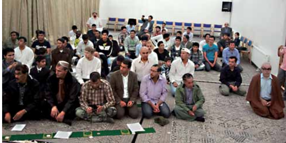
TOIMITILOJEN SALI ON JO OTETTU KÄYTTÖÖN.