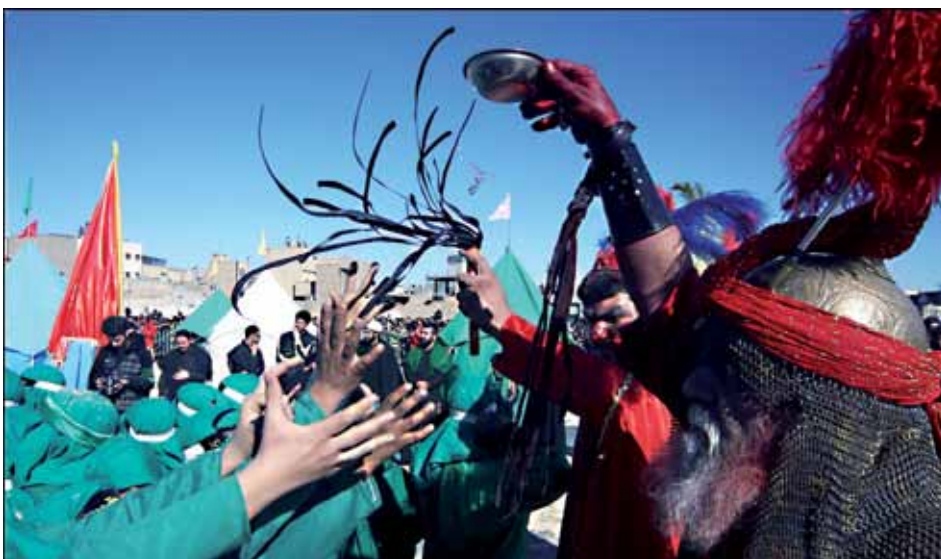
TÄNÄKIN PÄIVÄNÄ KARBALAN TAPAHTUMIIN ELÄYDYTÄÄN KATUTEATTEREISSA JOKA ASHURA.

Imaami = profeetan seuraaja ja muslimiyhteisön johtaja. Profeetan Talonväki = profeetan tytär Fatima, hänen puolisonsa Ali, heidän lapsensa Hassan ja Hussein sekä heidän jälkeläisensä