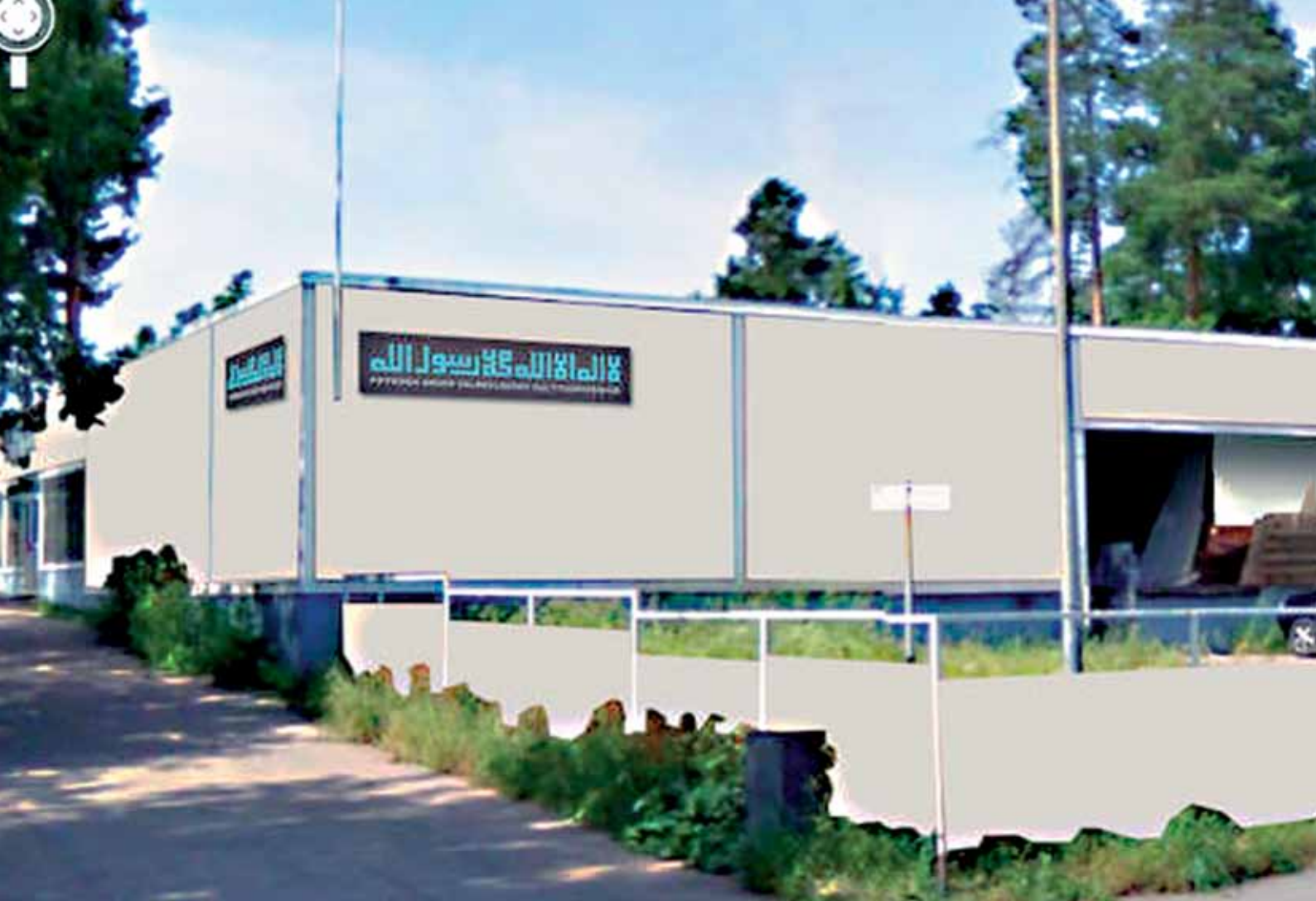
ARKKITEHDIN NÄKEMYS KULTTUURIKESKUKSEN UUDESTA JULKISIVUSTA.