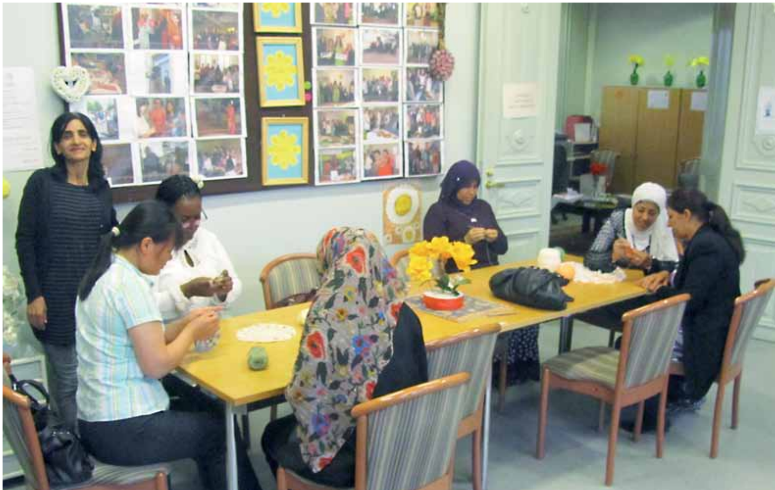
NAISET KERTOVALLE TOISILLEN LAPSUUDENKODIN MUISTOISTAAN KUTIMIEN JA VIRKKUUKOUKKUJEN KESKELLÄ. SE ON HYVIN TERAPEUTTISTA.