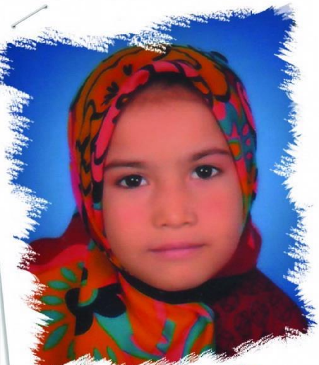
જલાલી તમન્ના ઝહેરા બિન્તે અબુલ હસન, ધંધુકા ઉમર: ૮ સાલ, રોઝા ૧