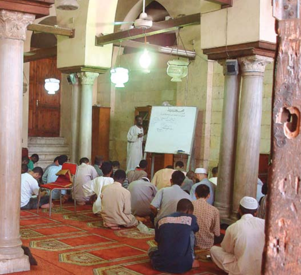
MIEN MATTOJEN PEITTÄMÄ JA ALABASTERIPYLVÄIDEN KORISTAMA.