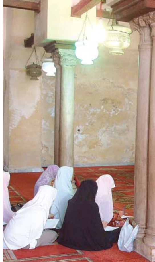
OPPITUNTI MENEILLÄÄN RUKOUSSALISSA, JOKA ON LÄMPÖ

Al-Azharissa puhkesi kapina brittijoukkoja vastaan vuonna 1918. Ihmiset kerääntyivät moskeijalle kuuntelemaan puheita, ja se oli ainoa paik-