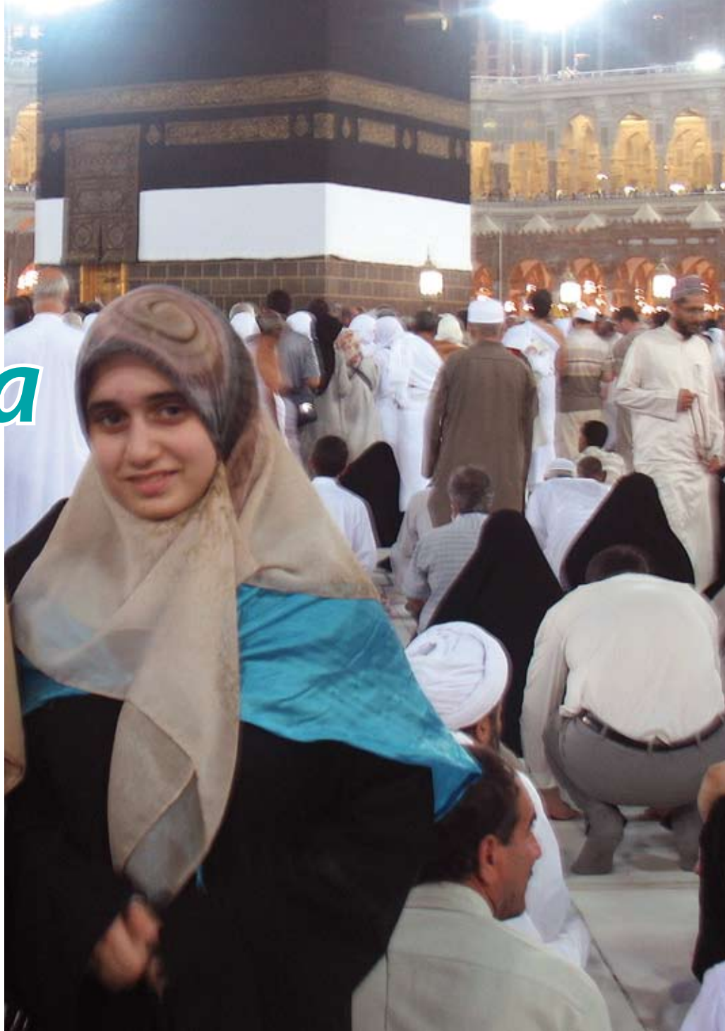
KAABA TEKİ SYVÄN VAIKUTUKSEN LIMAANIIN.

Matkan ensimmäinen etappi oli Iran. Limaanin mielestä silmiinpistävin ero Suomen ja Iranin katukuvissa oli naisten pukeutuminen. Iranissa naiset noudattivat islamilaista pukeutumiskoodia, hijabia. Nyt hui-via ja pitkää tunikaa käyttävä limaanki ei enää erottunut joukosta niin kuin täällä Suomessa. Iranista limaanki matka jatkui Saudi-Arabiaan, jonka pyhässä kaupungissa Mekassa py-