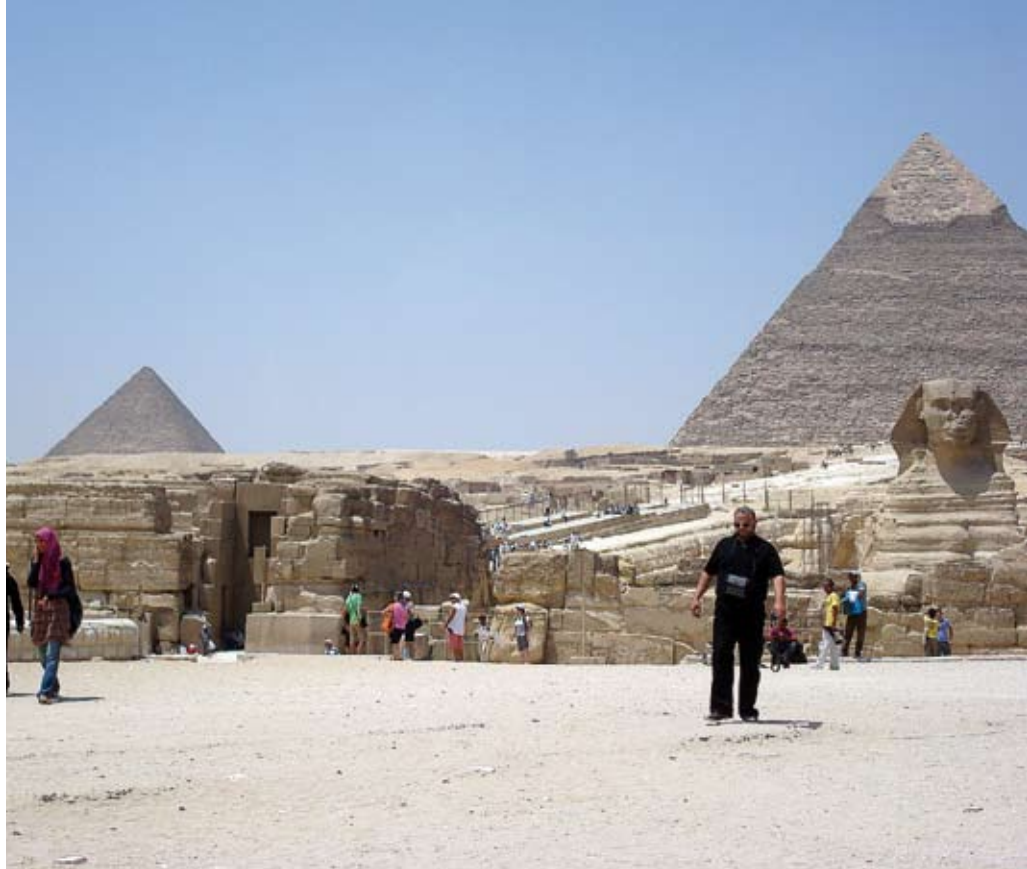
PYRAMIDIT OVAT EGYPTIN SUOSITUIN MATKAILUKOHDE.