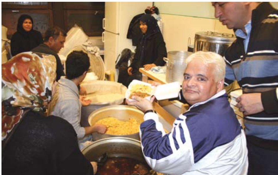
RUOKA ON OLENNAINEN OSA ASHURAN VIETTOA, EIKÄ YKSIKÄÄN SURIJA LÄHDE KOTIIN NÄLKÄISENÄ.

on helppo muidenkin kuin muslimien samastua