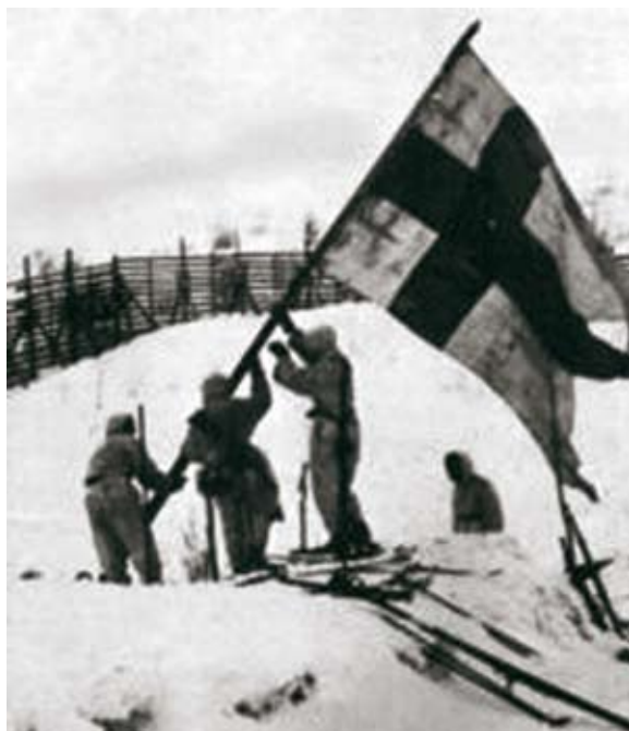
ISÄNMAAN PUOLESTA UHRAUTUMISTA ARVOSTETAAN SUKUPOLVESTA TOISEEN.