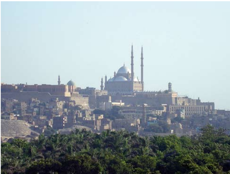
VOOSITTAIN EGYPTISSÄ VIERAILEE NOIN 10 MILJOONAA TURISTIA. KUVA KAIROSTA.

tiläs on lakimies ja lisäksi hänellä on ylempi korkeakoulututkinto islamin Sharia-laissa.