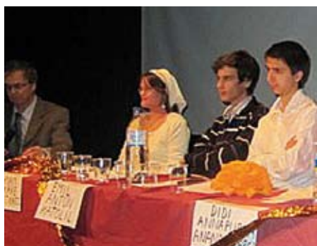
SEMINAARIN PANEELISSA NÄHTIIN EDUSTAJIA MONISTA USKONNOISTA JA ELÄMÄKATSOMUKSISTA. MUKANA OLIVAT ESIMERKIKSI HOLISTINEN ELÄMÄKATSOMUS, KATOLILAISSUUS, ISLAM.