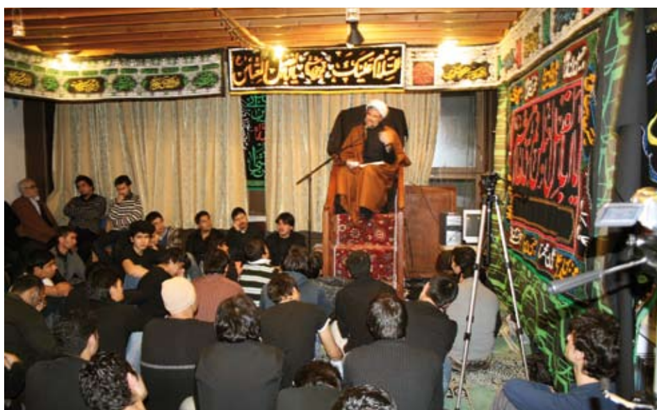
MUSLIIMIT KERÄÄNTYVÄT SURULIPUIN KORSTELTUUN MOSKEJAAN KUUNTELEMAAN TARINAA KARBALAN TAPAHTUMISTA JA SEN OPETUKSESTA.

Olen joskus miettinyt, vaikuttaako suomalaisuuteni tapaani viettää Muharram-aikaa. Saattaa olla; ainakin tapani on kovin hillittyä. Ulkoisesti suruaika näkyy kodissani mustina pitkinä kankaina, jotka kiinnitän olohuoneen seinien yläosaa kiertämään heti kuukauden alussa. Lisäksi ripustan seinille ne muutamaiset mustat kankaat Ashura-julisteet, jotka omistan. Näissä julisteissa muistetaan lyhyin lausein Ahlol-Beitiä (rauha heille) eli Profeetan perhettä. Minulle näiden ulkoisten ja näkyvien merkien merkitys on siinä, että haluan näin kunnioittaa Profeettaa ja hänen perhettään ja tukijoitaan. Mustat kankaat kotona herättävät joka vuosi kysymyksiä niissä vieraisissa, jotka tulevat käymään kotonani Muharramin aikana. Olen kuvannut "ulkopuolisille" Muharramia yleisesti suruaikana, jota vietetään Profeetan perheen ja meidän shiia-muslimien johtajien tapamisen vuoksi mutta myös yleisemmin maailman epäoikeudenmukaisuuden ja kärsimysten takia. Tähän